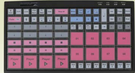
320 x 190 x 42mm 1.1kg

TRACKSHOT は、Audio CD から直接オーディオファイル (16bit 44.1kHz WAV) を取り込むことができます。