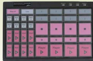
245 x 204 x 42mm 0.7kg