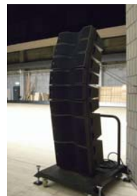
ステージスピーカ